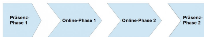
Abb 1: Blended-Learning Konzept des Kurses (eigene Darstellung)